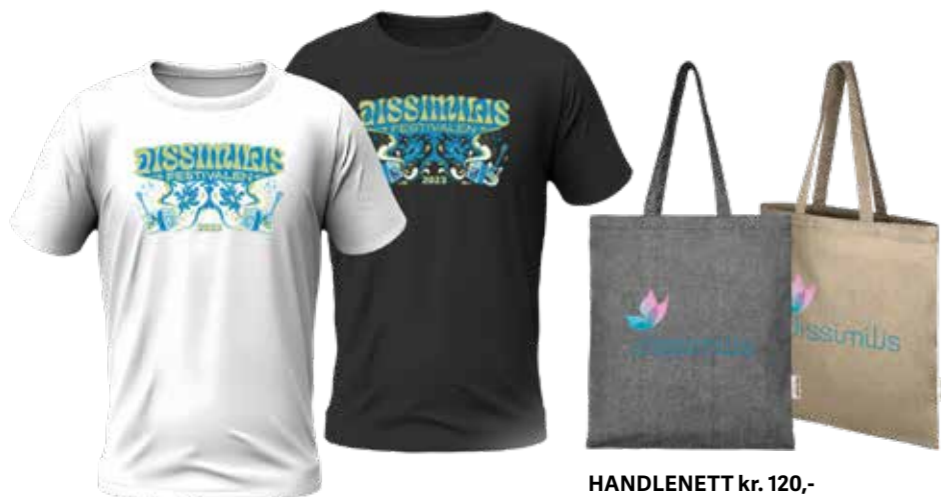
HANDLENETT kr. 120,-

FESTIVAL T-SKJORTE kr. 250,- Fåes i svart eller hvit XS – XXL